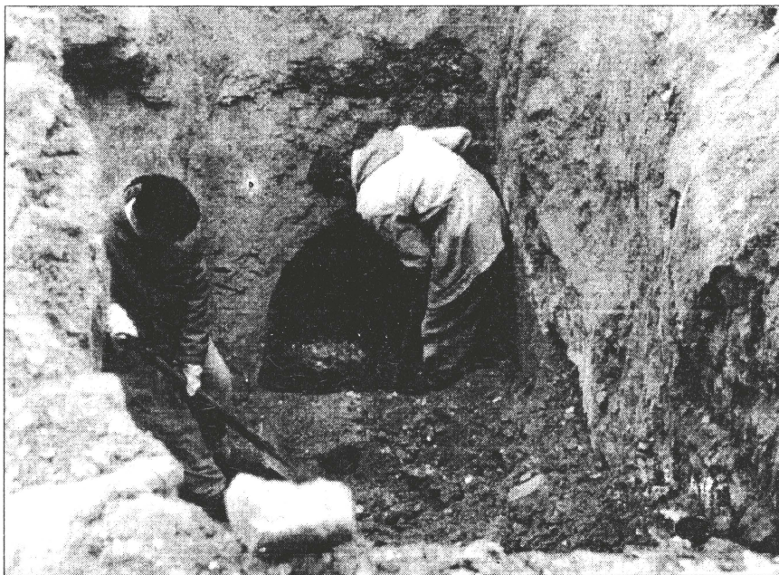
Полтава, вул.Бр.Литвинович, 15. Дослідження підземного ходу XVII-XVIII ст. Розкопки Центру охорони та досліджень пам'яток археології, 1998 р.

Подземелья эти, или подкопы, идут на глубине 3-6 сажень от поверхности земли 4 , сводообразными проходами, высотой в рост человека, а шириною в три и более аршина. Местами они снабжены слуховыми окнами, в виде круглых воронок, служившими для удаления вредного воздуха; они соединялись между собою отверстиями, проделанными в земляных простенках, сквозь которые свободно мог пролезть человек. Все это скорее ведет к заключению, что подземелья служили убежищами и хранилищами на случай нашествия неприятелей, особенно, если вспомнить существовавшие во второй половине XVII ст. набеги крымских татар на Полтаву 5 .