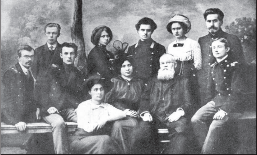
М. С. Грушевський серед представників полтавської української інтелігенції.