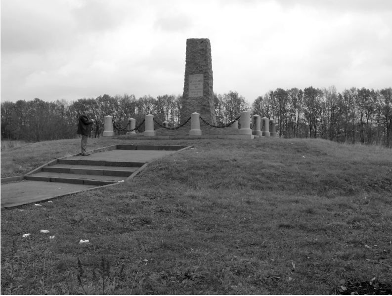
Рис. 2. Побиванка (Тахтаулове) с. Група курганів I. Насип № 1 з Пам'ятником шведам від шведів. З південного заходу, 2010 р.

ко 20 тон, і виготовлена скульптором Теодором Лундбергом сама стела [12; 13]. Умовою встановлення пам'ятника від імперського російського уряду була відсутність будь-яких барельєфів, скульптурних елементів та інших прикрас, окрім написів. Саме такі й вміщені у нижній частині з обох боків на двох мовах — шведській і російській: « At minnet af svenskar fallen har 1709 reste ladsman denna sten 1909 » і « В память шведам, павшим здесь в 1709 году. Воздвигнут соотечественниками в 1909 году » [6, с. 169; 7, с. 793].