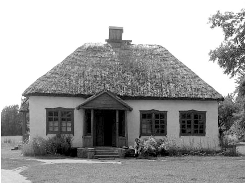
Рис. 2. Церковно-парафіяльна школа XIX ст. с. Лоташеве, Черкащина. Націон. музей народної архітектури та побуту України, с. Пирогів.

бігай без причини під час шкільної години; говори те, що завчив, а не порожні байки; добра кожному бажай і чим можеш допомагай; усього, з чого сварка виникає, стережися; не принижуй брата свого, що немиле самому, не чини нікому...» [11].