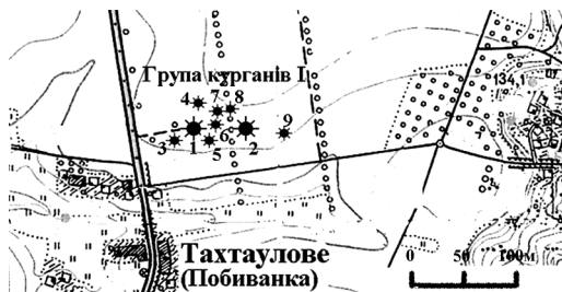
Рис. 1. Побиванка (Тихтаулове) с. Група курганів І. План. Основа: М 1: 25 000 см.

Ці поховальні пам'ятки — свідки первісної державності скіфської епохи на Полтавській землі — є не тільки виразними ландшафтними домінантами навколишньої території, місцем встановлення широко відомого історичного монументу, а й потенційними об'єктами туристичного показу. В разі необхідності, сусідні невеликі розорані кургани біля Пам'ятника шведам від шведів можуть бути об'єктами науково-рятивних археологічних розкопок з метою ілюстрування найраніших проявів державотворчих процесів в окрузі, віддалених від нашого часу на 2,7 – 2,5 тис. років.