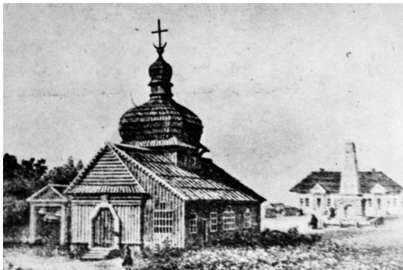
Рис. 1. Храм Спасу Нерукотворного образу у Полтаві. Поч. XIX ст.

манним дерев'яному зодчеству та перейнятим мурованою бароковою архітектурою, криволінійні фронтони абсид і розірваний сандрик головного порталу вочевидь вказують на приналежність церкви до барокової стилістики, натомість суворість не декорованих площин стін, лаконічні трикутні сандрики вікон, спрощена ордерність засвідчують потужний вплив аскетичної архітектури косялів-фортець (рис. 2).