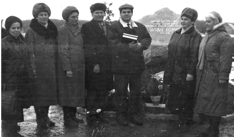
Рис. 4-5. На відкритті пам'ятного знаку Самійду Величку у с. Жуки Полтавського району. 29 листопада 1995 р.