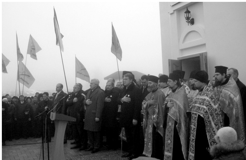
Рис. 6. Урочисті заходи біля новозбудованого Покровського храму. 2008 р.