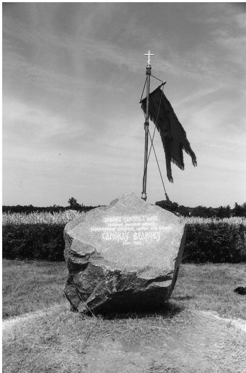
Рис. Пам'ятний знак літописцеві Самійлу Величку. 2005 р.