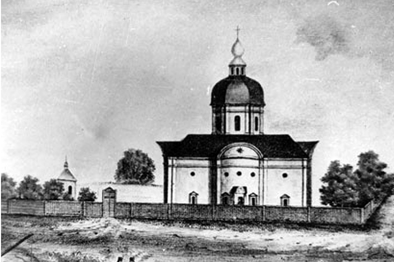
Рис. 2. Церква Покрови Пресвятої Богородиці. Мал. козака Чапіги [4]. 1850-і рр.

До числа втрачених об'єктів культурної спадщини Жуків належить кам'яниця маєтку Кочубеїв. Письмові згадки про її архітектурне вирішення або іконографічні матеріали не віднайдені. Можна припустити, що це була кам'яна житлова будівля за типом хати на дві половини. Зовнішній декор, імовірно, не вирізнявся багатством криволінійних форм, а, навпаки, був лаконічним, стриманим.