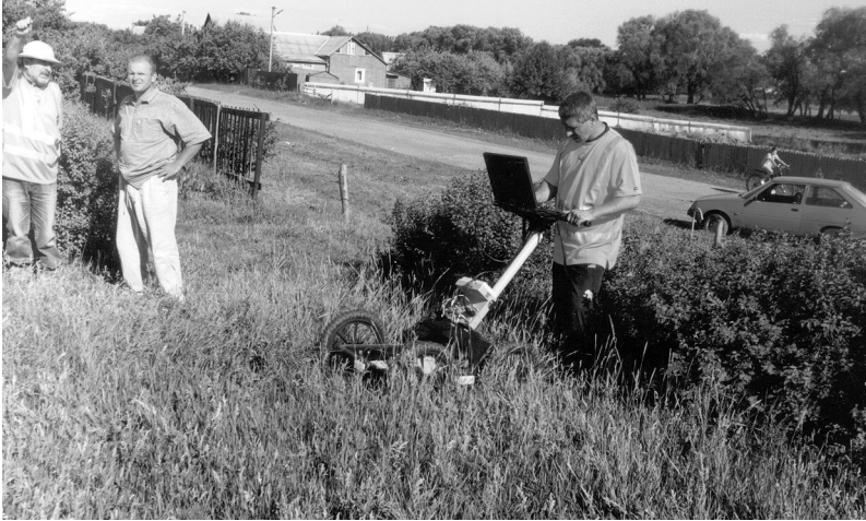
Рис. 3. Сканування поверхні на місці Покровської церкви за допомогою георадара.