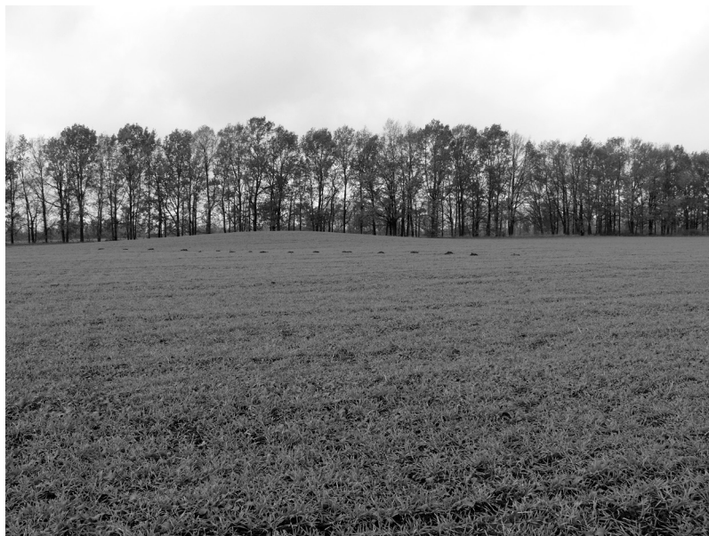
Рис. 3. Побиванка (Тахтаулове) с. Група курганів І. Курган № 2. Зі сходу. 2012 р.

праці І. Ф. Павловського [5, рис. 130]. Тоді вважалося, що, за переказами, саме тут могли бути влаштовані поховання кількох тисяч шведських воїнів і козаків, які загинули в ході битви. Насправді, місце захоронення останніх міститься за 2,6 км на південний захід, на протилежному березі і лівобічному плато струмка й не має рис колективних захоронень.