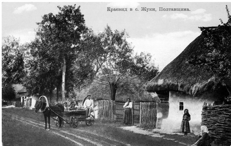
Краєвид с. Жуки. За поштовою листівкою поч. 1910 рр.

ського короля, але, за відсутності Карла XII, генерали не наважилися прийняти рішення. Це була остання спроба козаків І. Скоропадського об'єднатися з козаками І. Мазепи [6, с. 113].