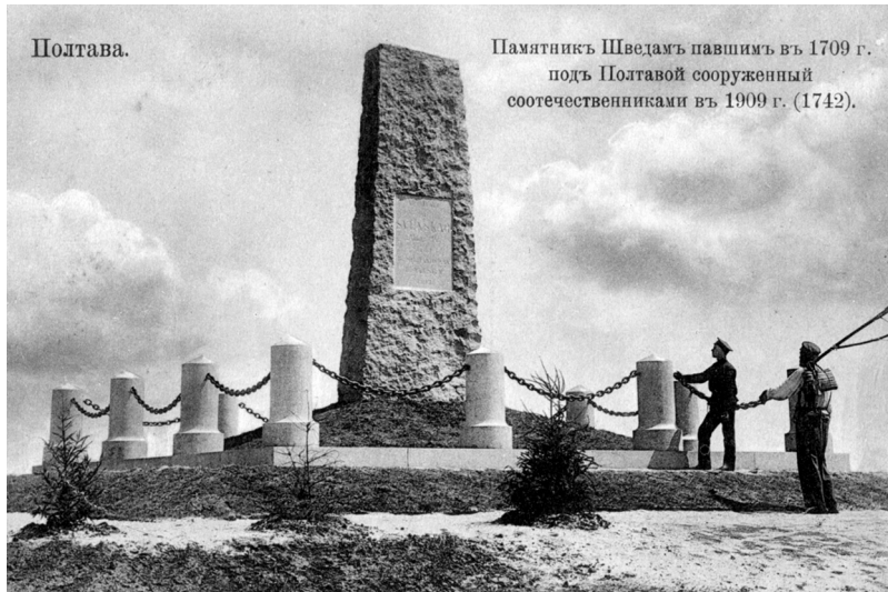
Рис. 3. Пам'ятник шведам від співвітчизників. 1909 р.

первісних 1770 р. Каплиця є центральним елементом храмового комплексу, у структурі якого містяться імпрровізована дзвіниця, скульптура Пресвятої Богородиці, пам'ятний знак Самійлу Величку.