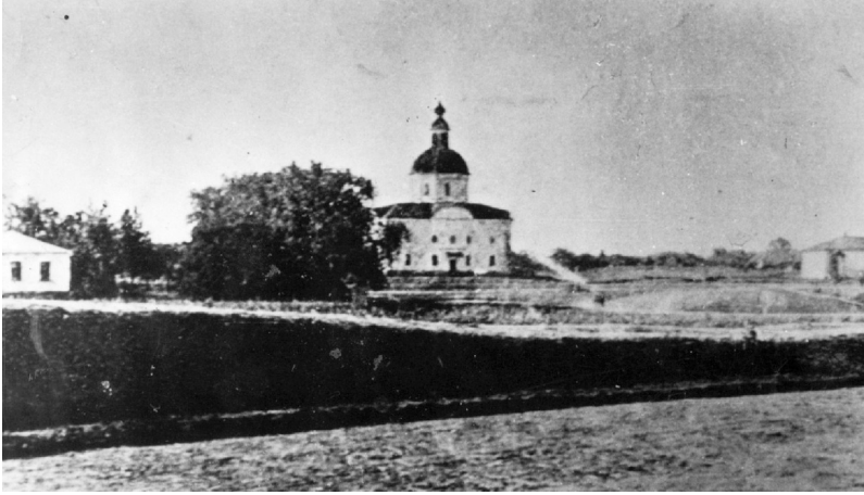
Рис. 1. Покровська церква, с. Жуки. Зруйнована 1952 р., залишки розібрані на поч. 1960-х рр. Фото поч. ХХ ст. Можливе місце поховання козацького літописця Самійла Величка.

У 2015 р. учні нашої школи були учасниками мітингу біля меморіального комплексу в Жуках, відзначаючи 345-річчя від дня народження Самійла Величка, 295 років його літопису та вже 20-річчя встановлення пам'ятного знаку.