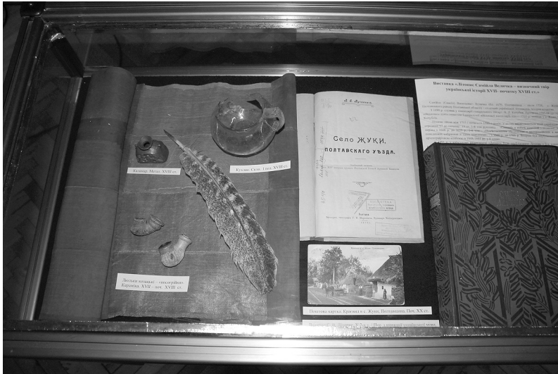
Одна з вітрин виставки в Полтавському краєзнавчому музеї, влаштованої до конференції.