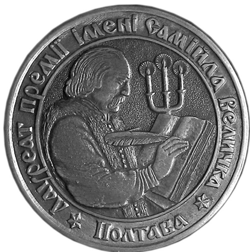
Рис. 1. Медаль «Лауреат премії імені Самійла Величка».

Авт. Д. Коршунов, В. Голуб, гравер К. Трейдін.