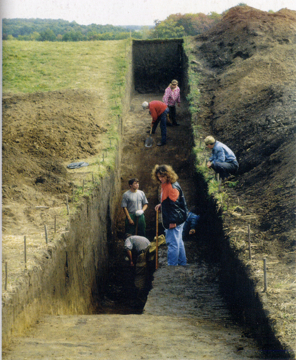
Перетин валу і рову Великого укріплення Більського городища в ур. Лісовий Кут. с. Більськ, вересень 1997 р.