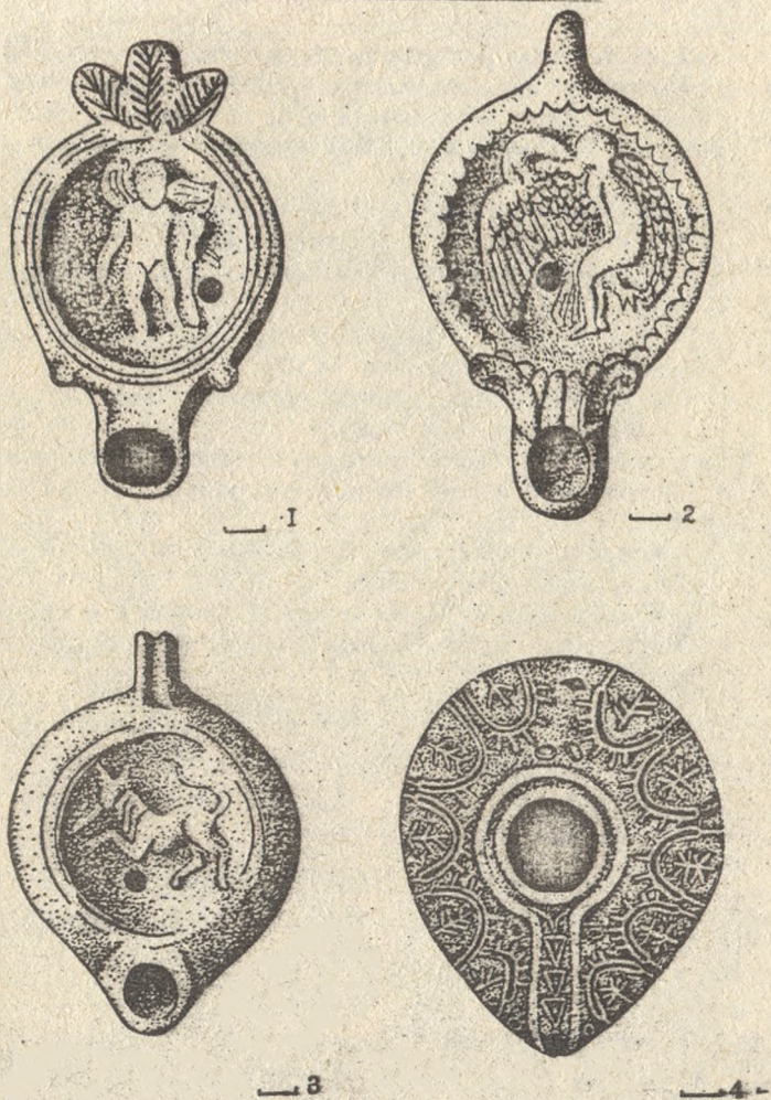
Мал. Античні світильники у зібранні Полтавського краєзнавчого музею Теракота. 1—I ст. н.е.; 2—VI-VII ст. н.е.; 3—II-III ст. н.е.; 4—V-VI н.е.